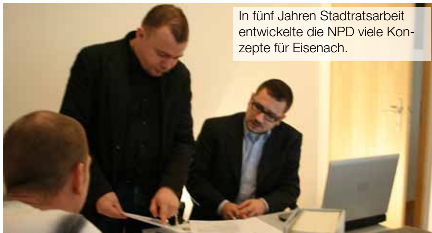
In fünf Jahren Stadtratsarbeit entwickelte die NPD viele Konzepte für Eisenach.